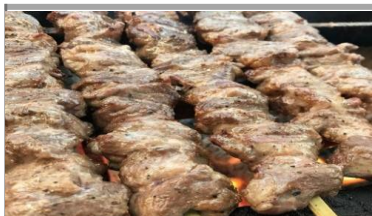
ジャンボ豚タン串