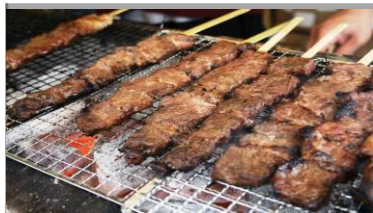
ジャンボ牛カルビ串