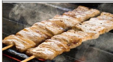
ジャンボ豚バラ串