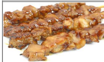
ジャンボ鶏もも串