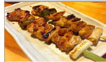
ジャンボ鶏ももねぎま串