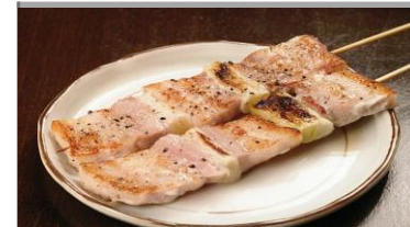
ジャンボ豚バラねぎま串