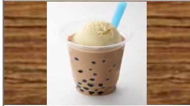
タピオカミルクフロート