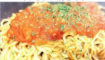
イタリアン焼きそば