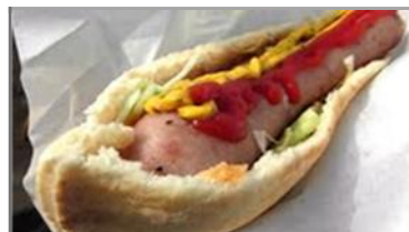
ソーセージピタドック