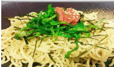
大葉明太 焼きそば