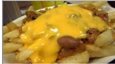
チリチーズポテト