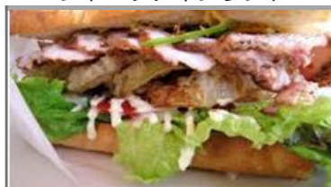
ジャークチキンサンド