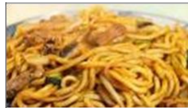
津山ホルモンうどん