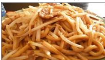
ふとっちょ なみえ焼きそば