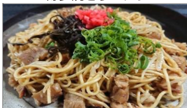
博多焼きラーメン