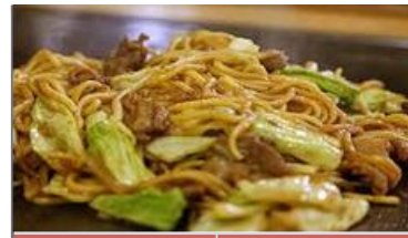
岡山ひるぜん風焼きそば