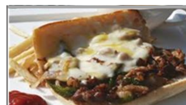
フィリーズチーズステーキ