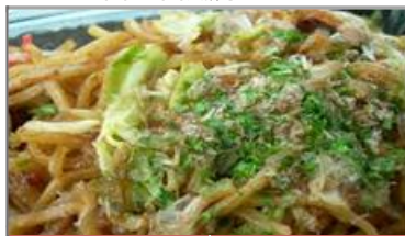
富士宮風焼きそば